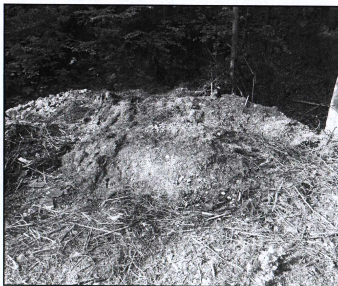
Skládky odpadů na břehu potoka....