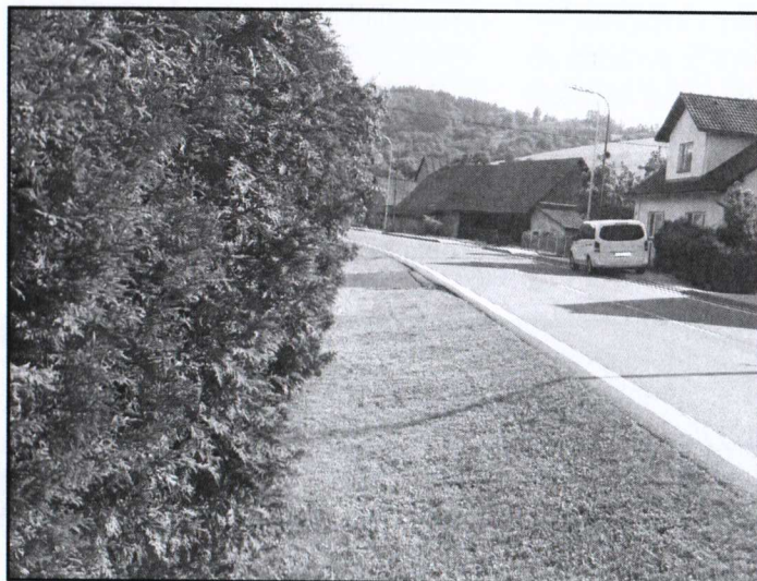
Parkování a pojíždění po chodníku znamená nejen ohrožení chodců, když musí vstoupit do vozovky, ale chodníky nikdy nebyly, a ani dnes nejsou budovány, pro zatížení pojížděním a parkováním ani osobních vozidel