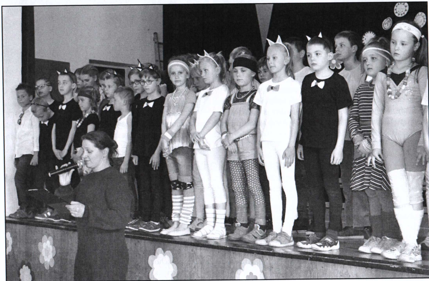
Děti ZŠ a MŠ při vystoupení na Dni matek

V letošním roce jeden z pedagogů dokončil specializační studium v oblasti environmentální výchovy