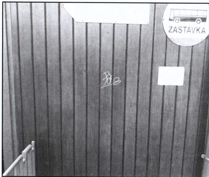
Malování po obecním majetku ???